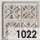
1022 Decapé Ocre / Ochre Decape