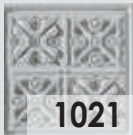
1021 Blanco Envejecido / Aged White