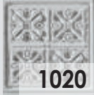
1020 Blanco Italia / Italian White