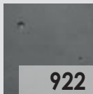
Antracita / Anthracite